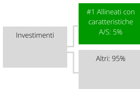
Grafico alimentato da dati:

#1 Allineati con caratteristiche A/S comprende gli investimenti del prodotto finanziario effettuati per il raggiungimento delle caratteristiche ambientali o sociali promosse dal prodotto finanziario.