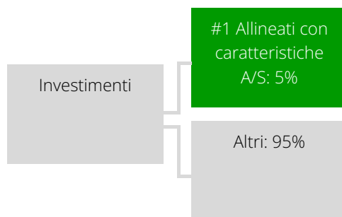
Grafico alimentato da dati:

#1 Allineati con caratteristiche A/S comprende gli investimenti del prodotto finanziario effettuati per il raggiungimento delle caratteristiche ambientali o sociali promosse dal prodotto finanziario.