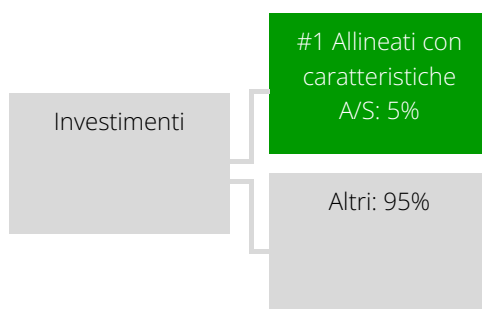
Grafico alimentato da dati:

#1 Allineati con caratteristiche A/S comprende gli investimenti del prodotto finanziario effettuati per il raggiungimento delle caratteristiche ambientali o sociali promosse dal prodotto finanziario.